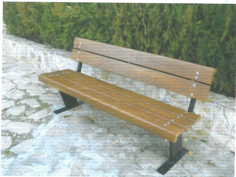
Пейка дървена 180/70/45