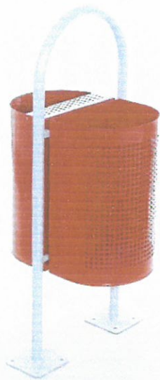
Кошче за отпадъци