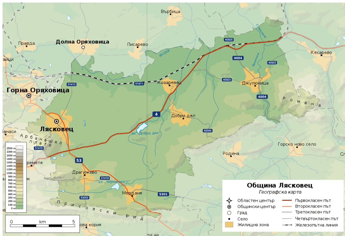
Фиг. 1 Териториално разположение на Община Лясковец.

Община Лясковец включва в територията си 1 (един) град - общинския център – гр. Лясковец и 5 (пет) съставни села – с. Мерданя, с. Драгижево, с. Добри дял, с. Козаревец и с. Джулюница (фиг.1).